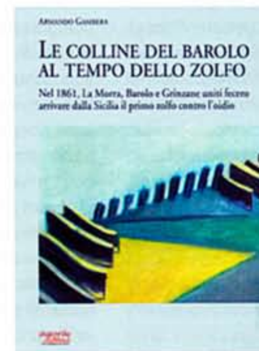
Armando Gambera LE COLLINE DEL BAROLO AL TEMPO DELLO ZOLFO Agorà, La Morra, 2014, pagg. 175

Fra questi, la trascrizione dall'originale dei testi di non facile reperibilità: "Un Cenno Enologico" (1859) e "La Crittogama Spacciata" (1861), "cenni" scritti dal vescovo di Biella Giovanni Pietro Losana, molto importanti per invitare i viticoltori ad avere fiducia nell'uso dello zolfo contro l'oidio.